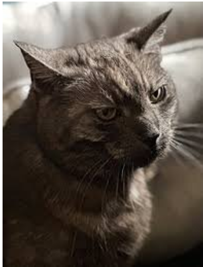
Kot domowy

Dlatego np. wyrazy zapisywane kot : kod wymawiamy tak samo: [kot]. To, że spółgłoska wygłosowa jest dźwięczna lub nie, słyszalne jest dopiero w przypadkach zależnych.