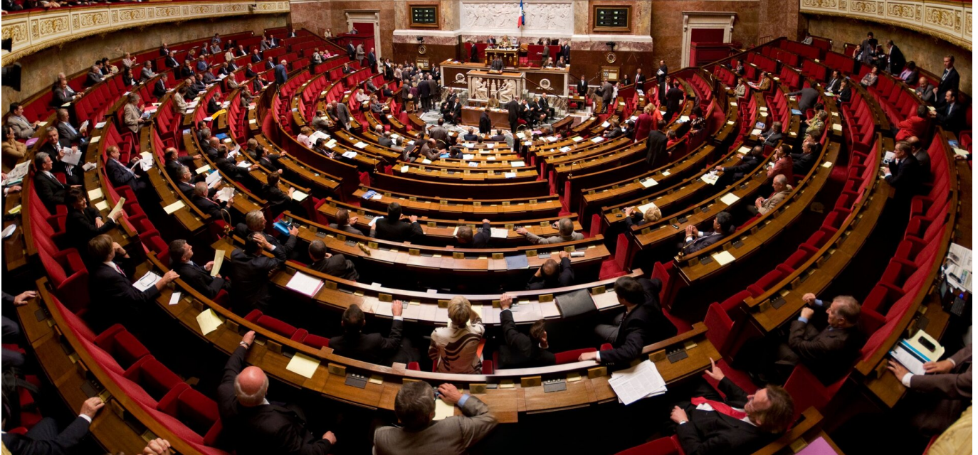
Izba Zgromadzenia Narodowego Francji