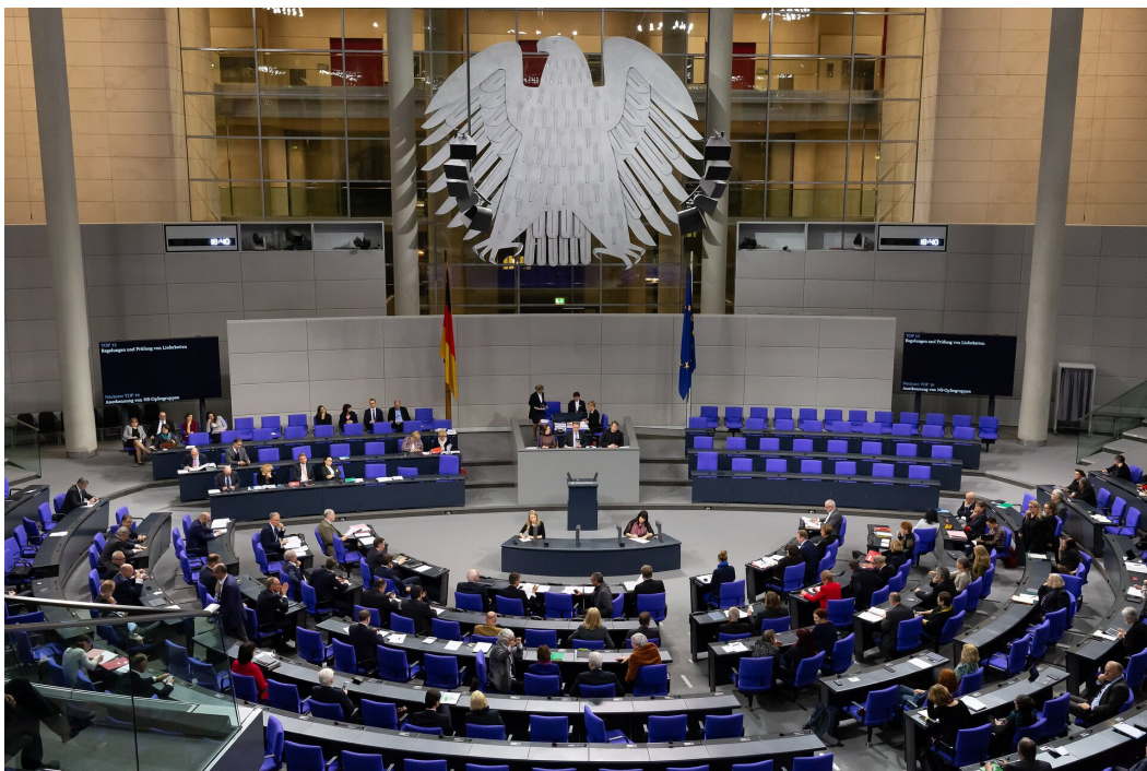
Bundestag – druga obok Bundesratu izba parlamentu Niemiec