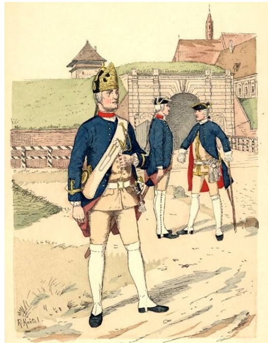
Bombardier pruski z połowy XVIII w. (na pierwszym planie). Jak nazywa się budowla widoczna w tle?

Utrzymanie wielkich armii wymagało rozbudowy magazynów i regularnego zaopatrzenia, o co miało dbać kwatermistrzostwo. Żołnierze, rzadziej odtąd zmuszani do rabunku, przestali być postrzegani jako wyrzutki społeczeństwa. Zwalczanie grabieży wiązało się także z dążeniem do zaostrenia dyscypliny. Zgodnie z zasadami taktyki linearnej wojsko szykowano do bitwy w płytkich szeregach, a starcia bitewne polegały przede wszystkim na wzajemnym ostrzale z armat i muszkietów. W tej sytuacji utrzymanie szeregu było możliwe tylko dzięki żelaznej dyscyplinie, a właściwie – zaszczerpieniu żołnierzom strachu przed oficerami i podoficerami.