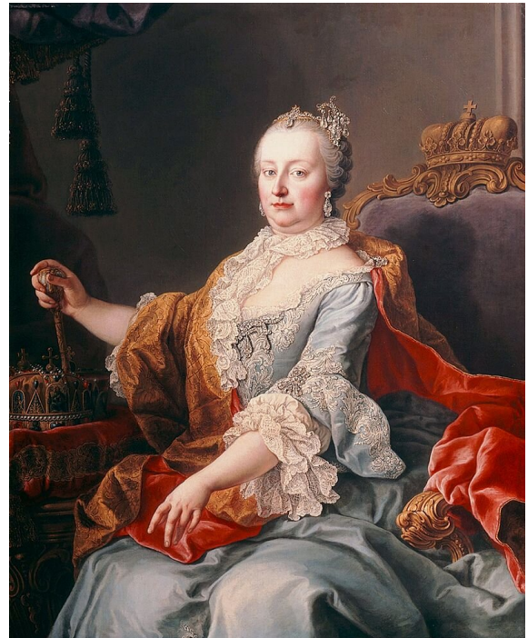
Maria Teresa (1717–1780). Cesarzowa wraz ze swym mężem Franciszkiem I zapoczątkowała dynastię habsbursko-lotaryńską.

Sukcesy Fryderyka II ośmieliły innych wrogów Habsburgów. Jedynie dzięki lojalności węgierskich poddanych i poparciu dyplomacji angielskiej Marii Teresie udało się obronić pozycję rodu. W 1748 r. strony zawierające pokój w Akwizgranie uznały tytuł cesarski używany od trzech lat przez jej męża Franciszka z dynastii lotaryńskiej. Uczyniły to za cenę zrzeczenia się przez Austrię Śląska i oddania części posiadłości w Italii Burbonom hiszpańskim. Największe korzyści odniosły Prusy oraz Anglia, która zdołała przywrócić równowagę sił na kontynencie, choć nie obyło się to bez wysiłku zbrojnego. Anglia wzięła udział w wojnie sukcesyjnej austriackiej. Wspólnie z Austriakami walczyła w Niderlandach przeciw Francuzom, a w 1746 r. a wojska szkocko-francuskie zagroziły Londynowi. Elementem konfliktu były również wojny w koloniach (np. w Indiach czy Ameryce Północnej).