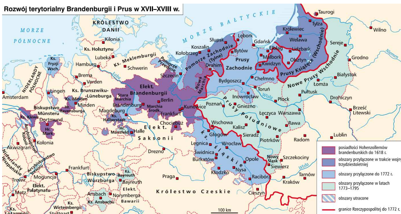
Rozwój terytorialny Brandenburgii i Prus w XVII–XVIII w.

Mapa przedstawiająca rozwój terytorialny Brandenburgii i Prus w XVII i XVIII w. Wymień nazwy polskich ziem zagarniętych przez Prusy w wyniku I rozbioru.