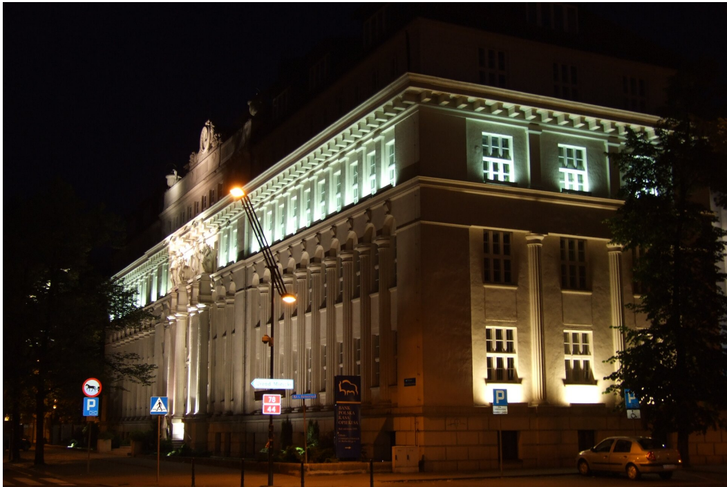
Wojewódzki Sąd Administracyjny w Gliwicach