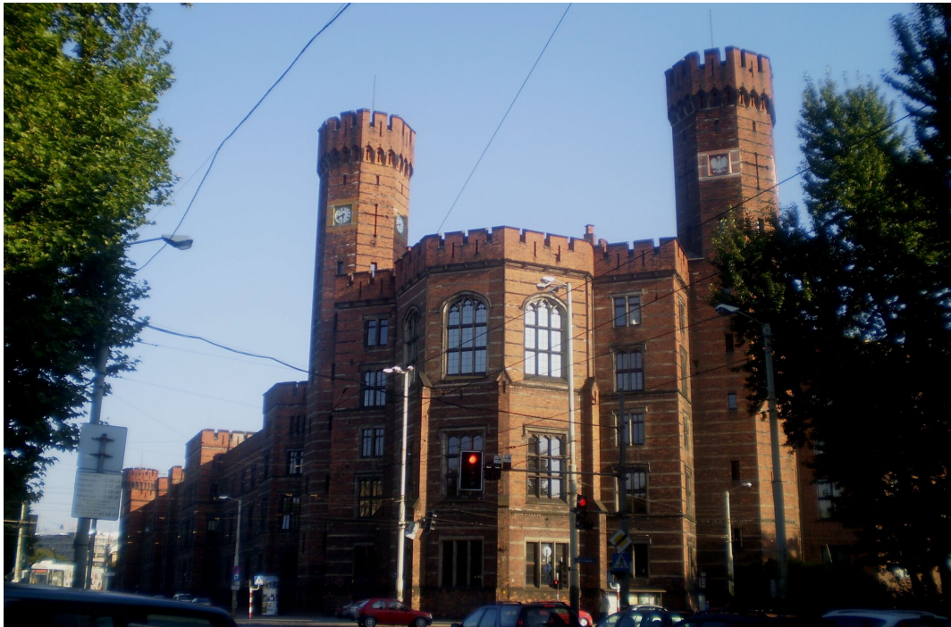
Sąd Okręgowy we Wrocławiu