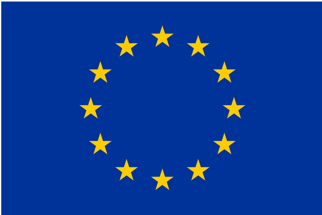
Flaga Unii Europejskiej