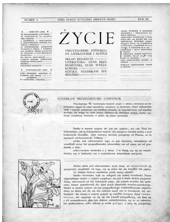
„Życie” (1899, nr 1)