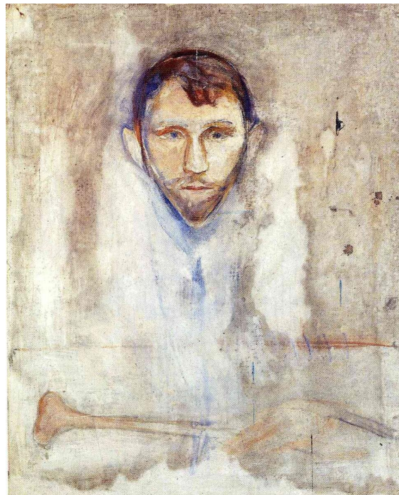
Edvard Munch, Stanisław Przybyszewski , 1894–1895

Stanisław Przybyszewski (1868–1927), nieformalny przywódca krakowskiej bohemy artystycznej , uznawał wszelką tendencyjność w literaturze za destrukcyjną. Jego zdaniem dzieło nie powinno zawierać żadnego konkretnego przesłania, lecz ukazywać życie we wszystkich jego przejawach – zarówno złych, jak i dobrych. Autor nie może cofać się przed drażliwymi tematami, opisem drastycznych sytuacji czy grzesznych występków. Wymaga tego szczerość w tworzeniu. Przybyszewski obalał tym samym oskarżenia o niemoralność sztuki młodopolskiej. Ukrywanie, przemilczanie – właśnie to było według niego niewybaczalne.