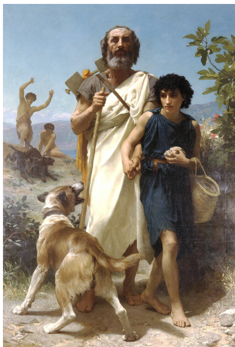
William-Adolphe Bouguereau, Homer i jego przewodnik , 1874