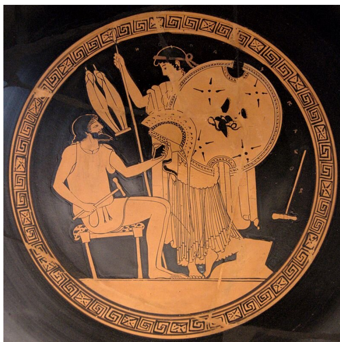
Hefajstos i Tetyda, V w. p.n.e. Hefajstos był twórcą tarczy Achillesa

Drobiazgowość opisu można łączyć z retardacją. Homer, wprowadzając jakąś postać lub przedmiot do fabuły, dokładnie przedstawia ten nowy element, poświęcając na to nawet ponad 100 wersów. Najbardziej znany przykład pochodzi z XVIII pieśni Iliady . Ukazana tam została – w wersach od 477 do 608 – tarcza wykuwana przez boga Hefajstosa dla Achillesa. Stosowanie retardacji przez greckiego twórcę wynikało m.in. z takiego kształtowania opowieści, aby odbiorca otrzymał szczegółową informację na każdy temat podjęty w dziele i by nie musiał się niczego domyślać.