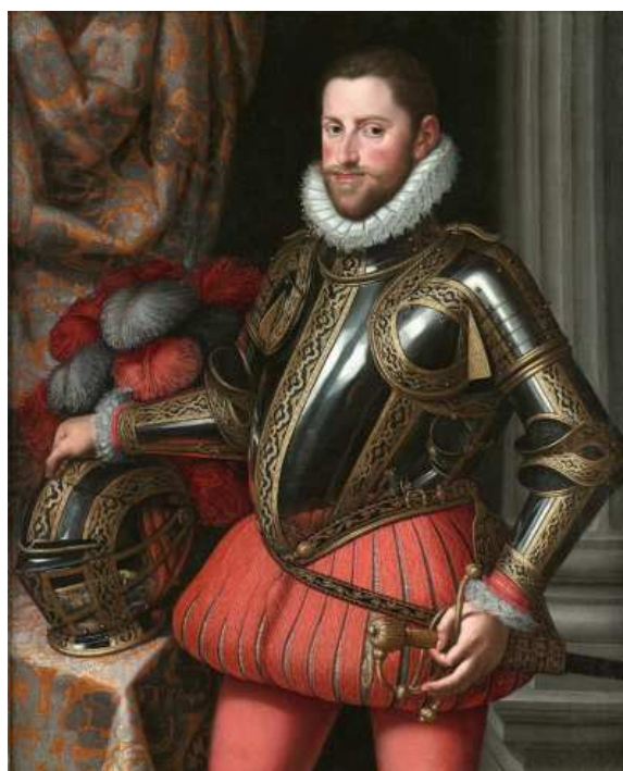
Portret arcyksięcia Ernesta z Austrii (1553–1595) Syn cesarza Maksymiliana II Habsburga i Marii Hiszpańskiej. Był jednym z kandydatów na króla Polski w 1573 r. W 1592 r. również otrzymał propozycję objęcia tronu polskiego, tym razem od Zygmunta III Wazy. Porównaj portret Ernesta z Austrii z portretami spokrewnionych z nim Habsburgów. Jakie podobieństwa zauważasz? Z czego one wynikają?

Najpoważniejszej kandydatury do tronu polskiego upatrywano początkowo w osobie arcyksięcia Ernesta Habsburga, choć przemawiała przeciw niemu zarówno polityka religijna, jak i tendencje absolutystyczne w krajach dziedzicznych tej dynastii. Trudno było poważnie traktować kandydaturę księcia legnickiego Henryka XI (wprawdzie rodowitego Piasta, ale za to alkoholika i birbanta ) lub popieranego przez Litwinów Iwana IV Groźnego czy wreszcie króla Szwecji Jana III Wazy, który chciał pokrzyżować plany carowi Rosji. W tej sytuacji jedynym kandydatem możliwym do zaakceptowania dla obozu antyhabsburskiego pozostawał brat króla Francji, Henryk Walezy. Wprawdzie podejrzewano go o uczestnictwo w rzezi protestantów w noc św. Bartłomieja, niemniej Habsburg wydawał się bardziej niebezpieczny dla porządku w Rzeczypospolitej.