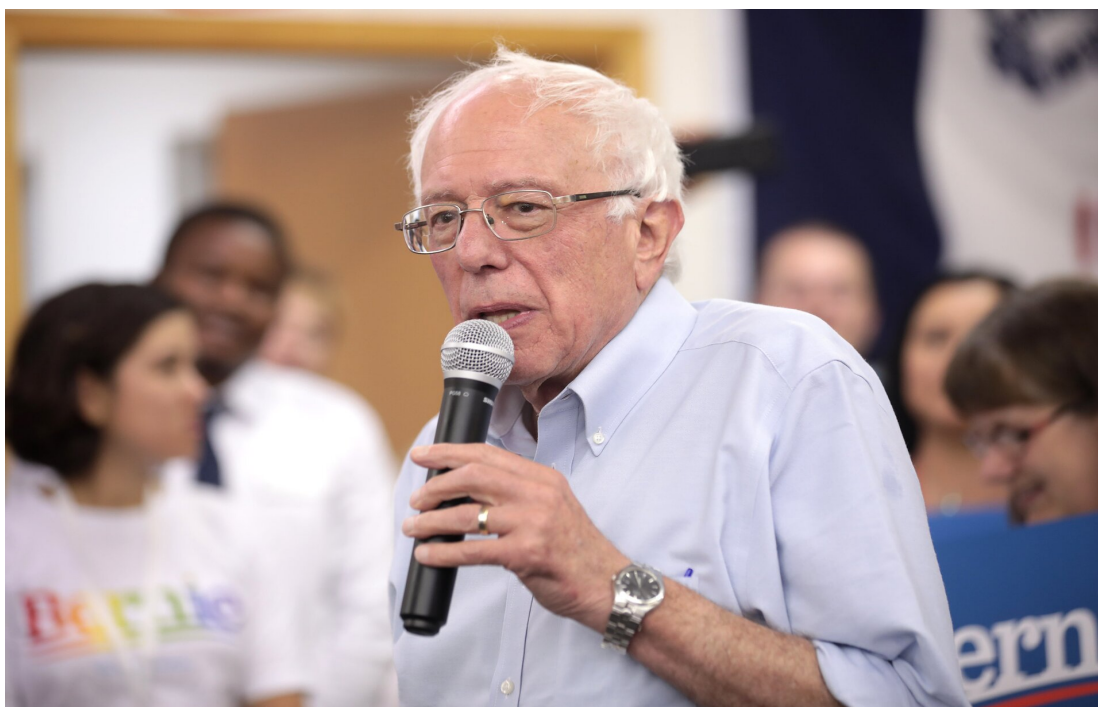
Przemówienie senatora Bernarda Sandersa (USA)

W starożytnych Atenach celem wychowania było przygotowanie młodych ludzi do życia publicznego, w którym mieli wziąć udział jako obywatele. Przeanalizuj sytuacje przedstawione na poniższych ilustracjach i zastanów się, która szkoła, Sokratesa czy sofistów, przygotowywałaby według ciebie lepiej do współczesnego życia publicznego? Potraktuj poniższe zdjęcia jako przykłady – możesz odwołać się do innych, wybranych przez siebie sytuacji.