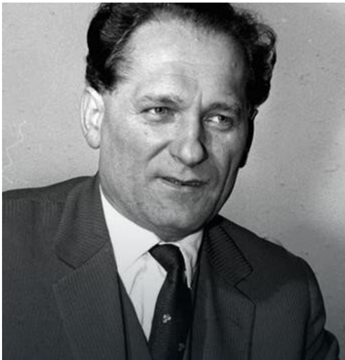
Mieczysław Moczar – minister spraw wewnętrznych w latach 1964–1968.