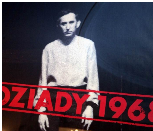
Gustaw Holoubek jako Gustaw w spektaklu Dziady z 1968 r.