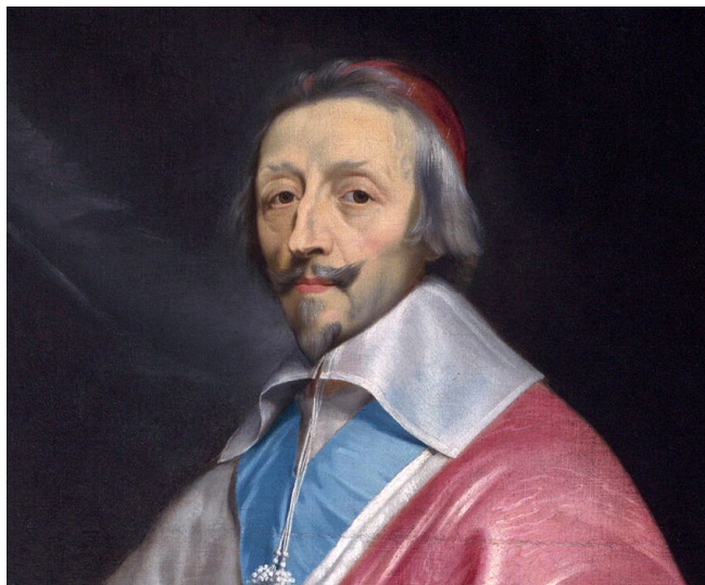
Armand Jean Richelieu (1585–1642). Zręczny polityk i genialny mediator, przez wiele lat współrządził Francją. Stworzył prywatną armię szpiegów, a także oddział muszkietierów. Przypomnij sobie, w jakim słynnym dziele została utrwalona jego postać.

Podstawą przewagi Francji nad sąsiednimi mocarstwami było wzmocnienie władzy centralnej w tym kraju. Za sformułowaniem tym kryje się pięciokrotny wzrost dochodów skarbu, będący efektem proporcjonalnego podniesienia podatków. Było to dziełem kardynała Armanda Richelieu, który w latach 1624–1642 piastował urząd pierwszego ministra króla Ludwika XIII, oraz jego następcy na tym urzędzie, kardynała Jules'a Mazarina. Dopiero po śmierci tego ostatniego w 1661 r. faktyczną władzę objął 23-letni król Ludwik XIV, a jego długie, trwające aż do 1715 r. panowanie wypełniły liczne wojny.