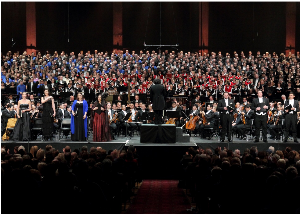
Alexander Vinogradov (fot.), Simón Bolívar Symphony Orchestra of Venezuela (Wenezuelska Narodowa Orkiestra Symfoniczna im. Simóna Bolívara) w trakcie wykonywania VIII Symfonii (Symfonii Tysiąca) Mahlera, 2011, Filharmonia w Los Angeles, Stany Zjednoczone, darkhoneybass.info, CC BY 3.0