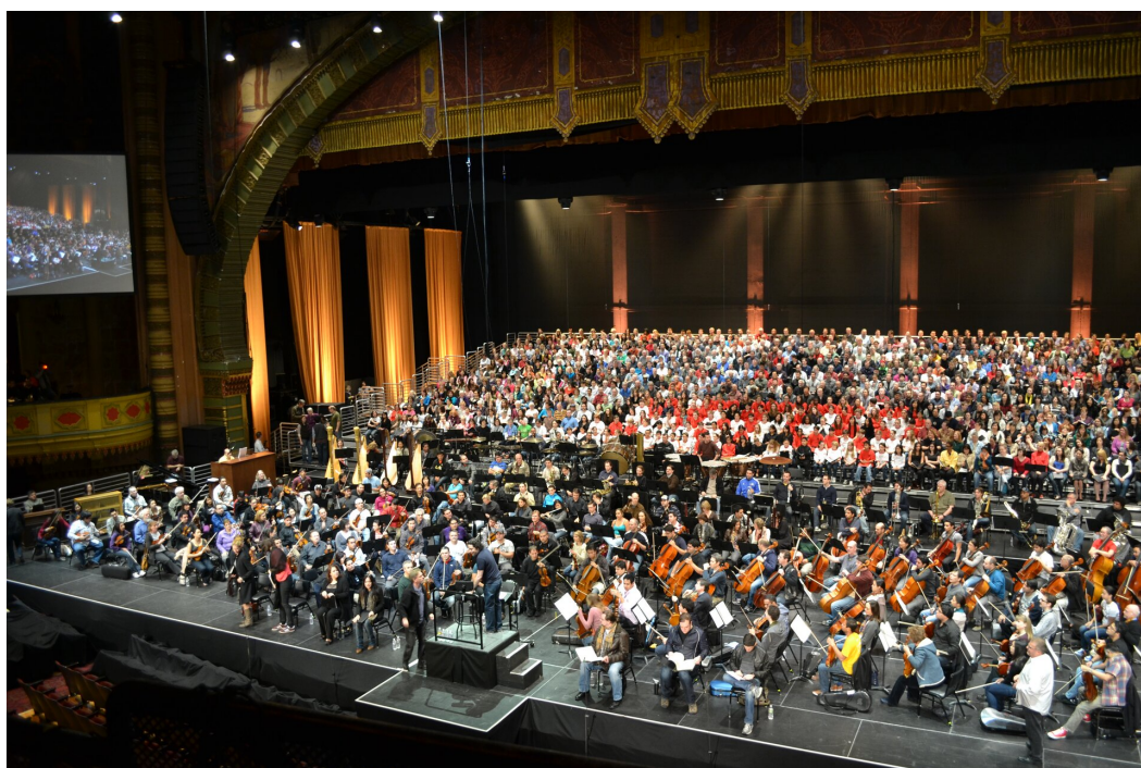
Alexander Vinogradov (fot.), Simón Bolívar Symphony Orchestra of Venezuela (Wenezuelska Narodowa Orkiestra Symfoniczna im. Simóna Bolívara) w trakcie wykonywania VIII Symfonii (Symfonii Tysiąca) Mahlera, 2011, Filharmonia w Los Angeles, Stany Zjednoczone, darkhoneybass.info, CC BY 3.0

Gustav Mahler, Symfonia No. 8 „Tysiąca”, Veni Creator Spiritus, 1910, online-skills, CC BY 3.0