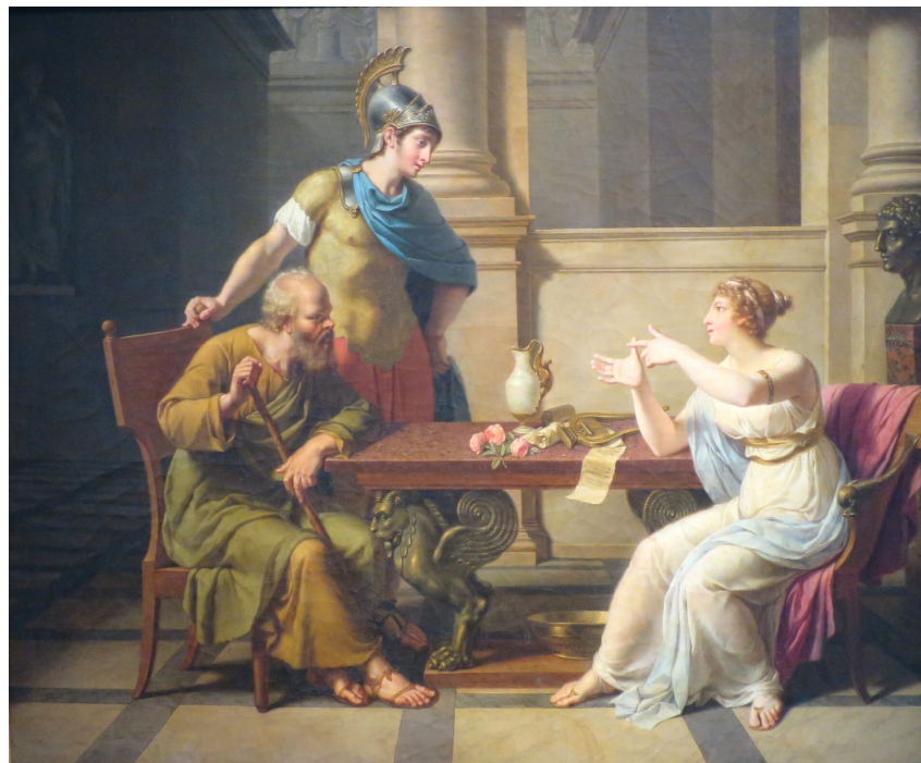
Debata Sokratesa i Aspazji

Źródło: Nicolas-Antoine Monsiau, domena publiczna.