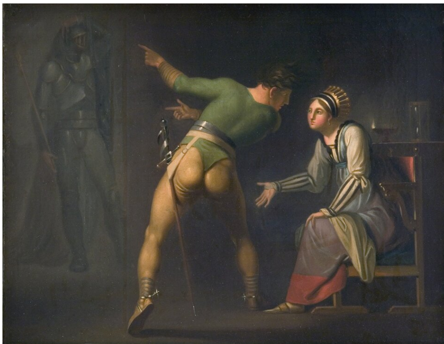
Nicolai A. Abildgaard, Hamlet próbujący pokazać swojej matce Gertrudzie ducha swojego ojca , ok. 1778