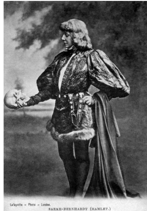
James Lafayette, portret aktorki, Sarah Bernhardt, w roli Hamleta