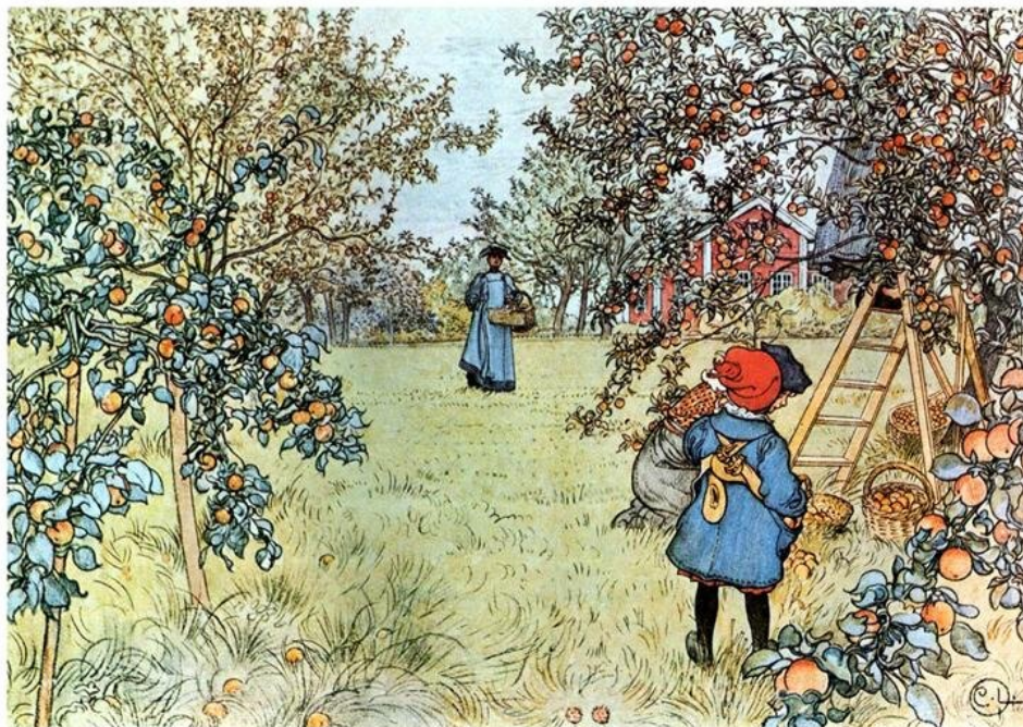
Dzieci w sadzie

Źródło: Carl Larsson [czyt. karl larson], 1903, domena publiczna.