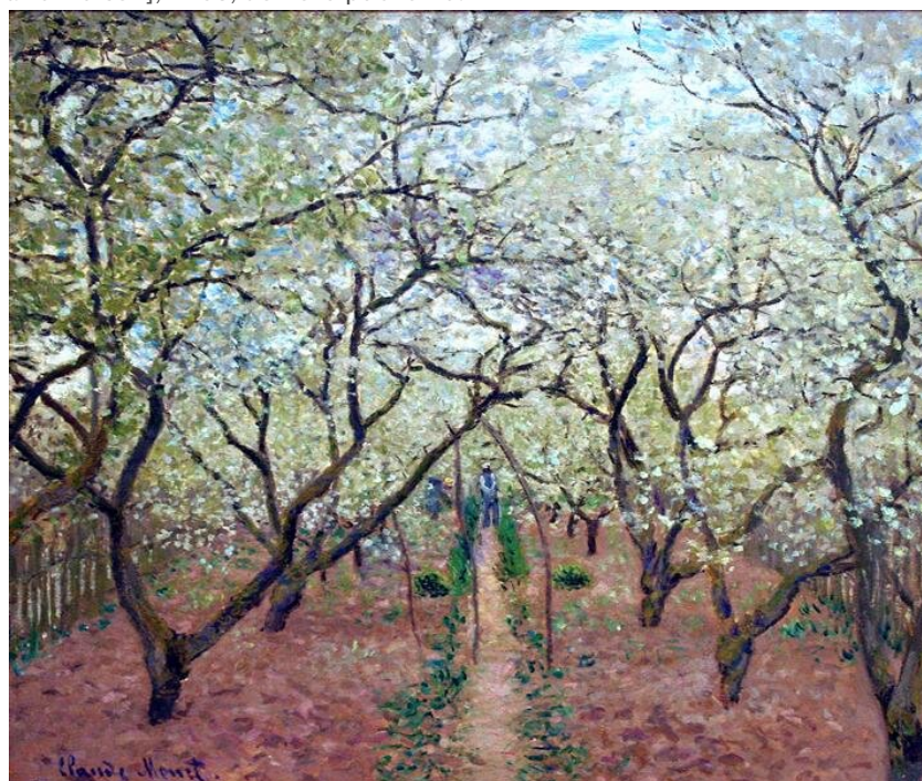
Sad w rozkwicie

Źródło: Carl Larsson [czyt. karl larson], 1903, domena publiczna.