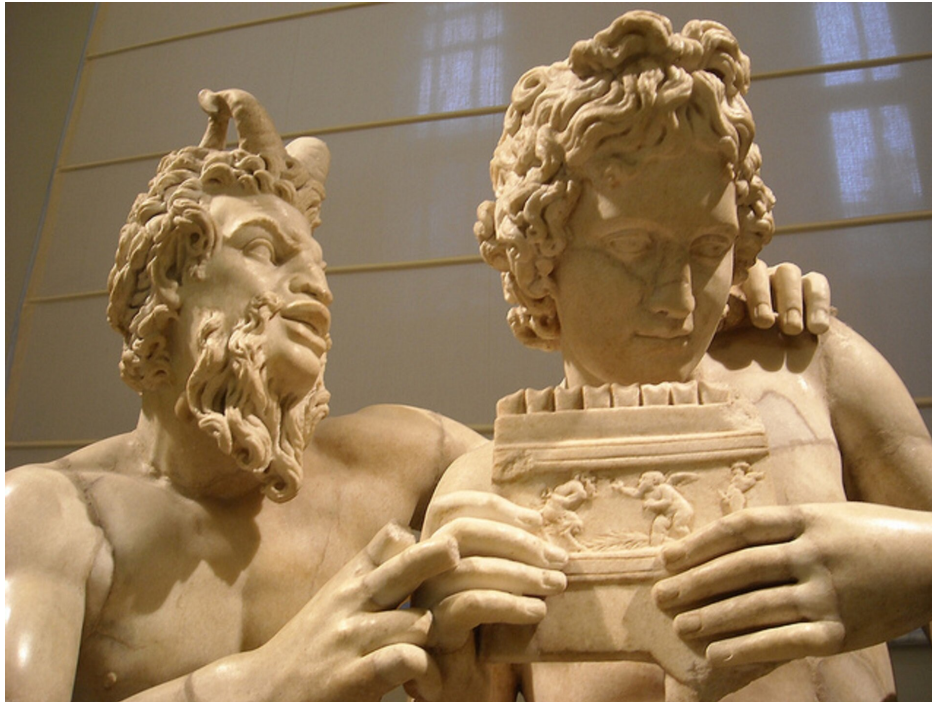
Bożek Pan uczący młodego pasterza gry na syrindze

Fletnia Pana, znana także pod nazwą syringa lub syrinx, była instrumentem pasterskim. Jej nazwa pochodziła od bożka Pana. Fletnia Pana składała się z szeregu piszczałek, najczęściej 5 lub 7, ułożonych według różnej długości i wysokości dźwięku.