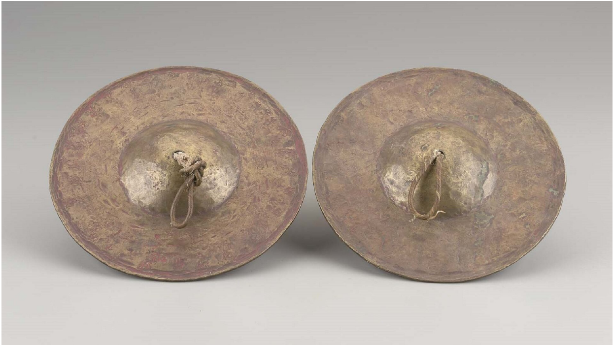
Kymbala (talerze perkusyjne)

W starożytnej Grecji używane były jeszcze instrumenty perkusyjne, jak chociażby bęben ramowy (tympanon), talerze perkusyjne (kymbala), kołatki (krotala).