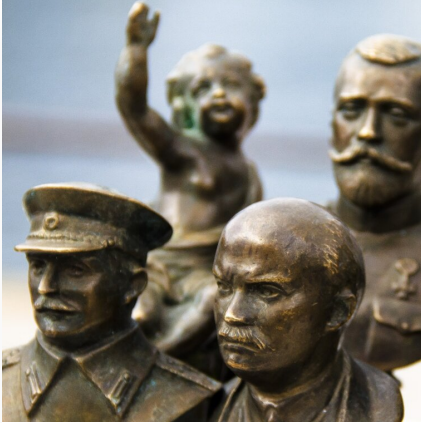
Ideologie totalitarne – podsumowanie