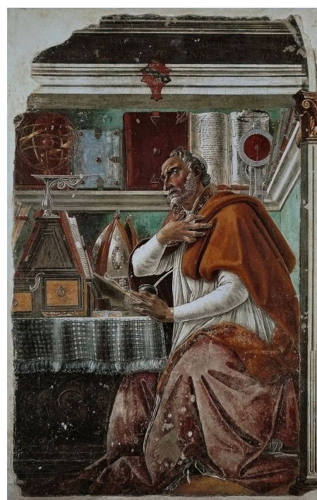
Sandro Botticelli, Święty Augustyn, 1480, fresk

Za jednego z najważniejszych prekursorów powieści psychologicznej uważa się powieść sentymentalną, która cieszyła się ogromną popularnością w epoce oświecenia. Jej oficjalnym twórcą był duchowny anglikański Laurence Sterne , autor Podróży sentymentalnej przez Francję i Włochy