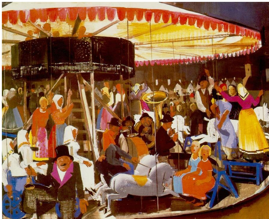
Vilmos Aba-Novak, Karuzela , 1931

Kolejnym istotnym elementem wiersza jest ruch, któremu podlegają wszystkie przedmioty, a wraz z nimi człowiek. W ten sposób Białoszewski ukazuje sposób istnienia ludzi w świecie rzeczy. Skojarzenie z ruchem karuzeli odzwierciedla tempo codziennego życia.