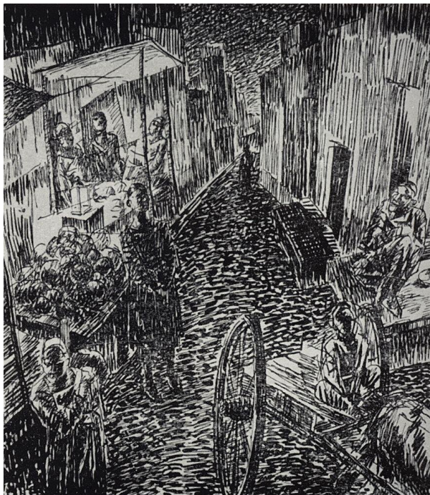
Kuzma Petrov-Vodkin, Ulica , 1923