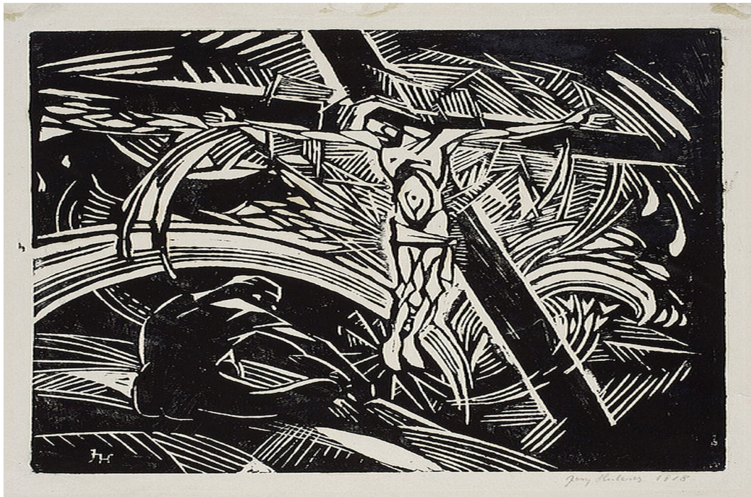
Jerzy Hulewicz, „Krzyż”, 1918, linoryt, Muzeum Narodowe w Warszawie, wikimedia.org, Domena publiczna