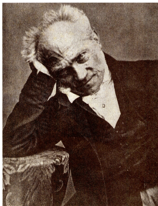
Arthur Schopenhauer

Najważniejszymi źródłami poglądów Schopenhauera były nauka Kanta i filozofia buddyjska. Podobnie jak Kant, Schopenhauer uważał, że nie poznajemy rzeczy, a jedynie zjawiska; podążając zaś za myślą Wschodu, uznał, że zjawiska te są jedynie naszymi złudzeniami. W filozofii Kanta prawdziwa „rzecz sama w sobie” była niepoznawalna, istniała bowiem gdzieś poza sferą porządkowanego przez ludzki umysł świata zmysłowego. Schopenhauer zmodyfikował ten pogląd. Prawdziwej rzeczywistości zewnętrznej człowiek nie może poznać, gdyż próbując ją zbadać, poznaje jedynie swoje wrażenia jej dotyczące. Dlatego też należy odwrócić się od świata zewnętrznego i zacząć badać własne wnętrze.