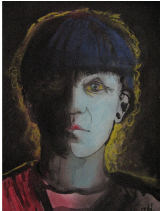
Zbigniew Kresowaty, portret Ewy Demarczyk (1941–2020), najśłynniejszej wykonawczynie wierszy K. K. Baczyńskiego

Źródło: Zbigniew Kresowaty, Ewa Demarczyk-portret , licencja: CC BY-SA 3.0.