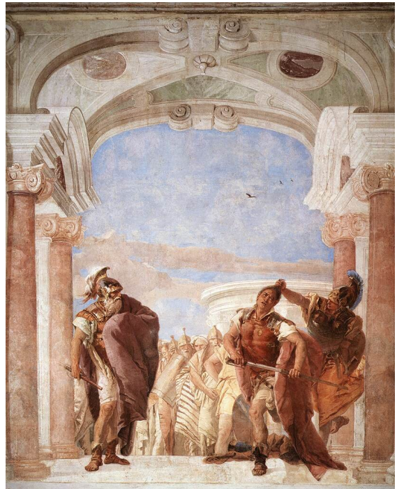
Giovanni Battista Tiepolo, Gniew Achillesa , 1757 r.

Cechy charakterystyczne eposu starożytnego można rozpoznać, analizując konkretne utwory powstałe w Grecji i Rzymie, ale także zapoznając się z dziełami teoretycznoliterackimi pochodzącymi z tego okresu, szczególnie z odpowiednimi fragmentami Poetyki Arystotelesa oraz Listu do Pizonów , znanego również jako Sztuka poetycka Horacego .