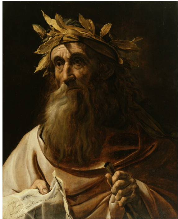
Anonim (mistrz holenderski), Portret poety Homera , 1639