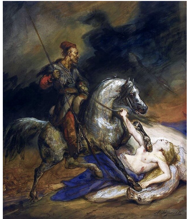
Ary Scheffer, Alegoria powstania listopadowego (Polonia) , 1831

Improwizacja ma charakter bliski szamańskiemu seansowi wyprawy w zaświaty, podejmowanemu przez szczególnego reprezentanta wspólnoty, którego zadaniem jest postawienie diagnozy i uzyskanie odpowiedzi na kluczowe dla jej istnienia pytania. [...]