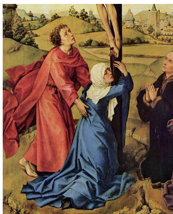
Rogier van der Weyden, Ukrzyżowanie Jezusa Chrystusa (fragment), 1440–1445