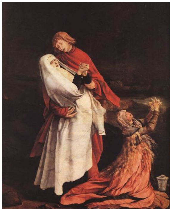
Matthias Grünewald, Ołtarz z Isenheim – Ukrzyżowanie (fragment), 1506–1515

Przeczytaj poniższe cytaty oraz przyjrzyj się fragmentom obrazów przedstawiających Matkę Bożą pod krzyżem. Wskaż tekst i obraz, które najlepiej, według ciebie, oddają wizerunek kobiety cierpiącej z powodu śmierci syna. Odpowiedź uzasadnij.