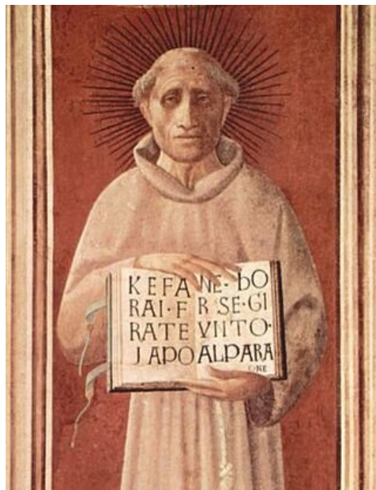
Paolo Uccello, Jacopone da Todi na fresku w katedrze w Prato, 1435–1440

tylko popularna, ale też weszła w skład kościelnej liturgii. Tekst został napisany w języku łacińskim. Temat Matki Boskiej pod krzyżem łączy się w tym utworze z kilkoma motywami: rozdzierającym bólem, rozpaczą spowodowaną widokiem umierającego dziecka, chęcią współodczuwania bólu fizycznego z Synem. Wszystkie te elementy pojawiać się będą w innych utworach średniowiecznych pokazujących Matkę Boską jako zwyczajną kobietę, która cierpi, patrząc na swoje umierające dziecko.