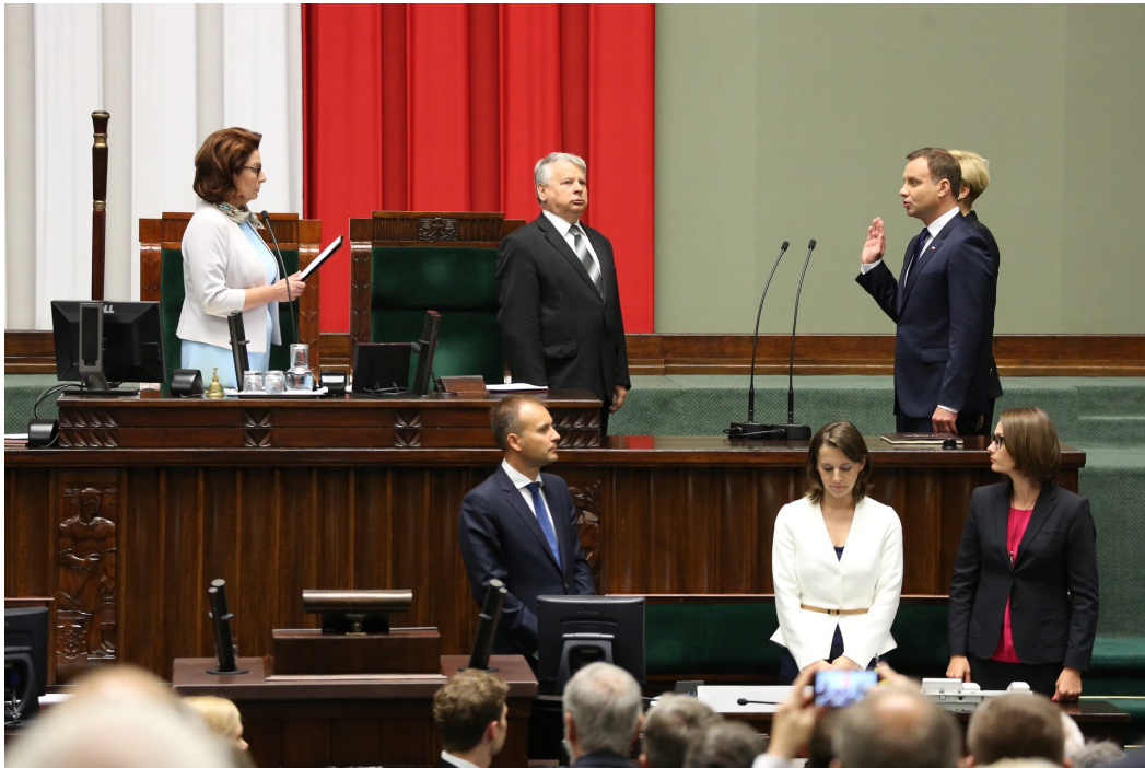
Prezydent Andrzej Duda składający przysięgę przed Zgromadzeniem Narodowym, 6 sierpnia 2015.