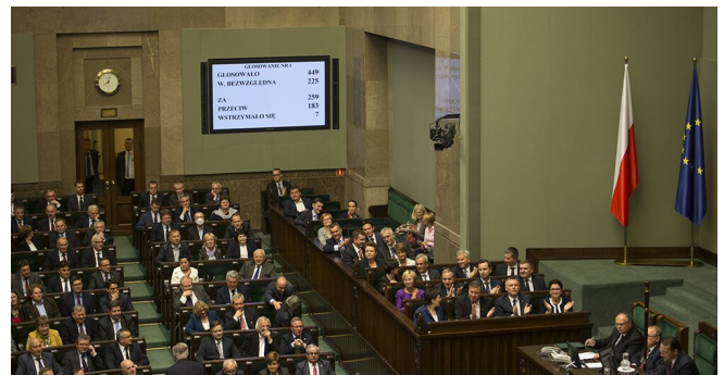
Głosowanie w sejmie nad wotum zaufania dla rządu Ewy Kopacz, 2014. Zwróć uwagę na telebim prezentujący wyniki głosowania.