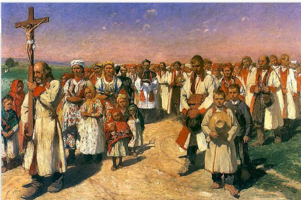
Włodzimierz Tetmajer, Procesja w Bronowicach , 1900

Źródeł wielu zachowań bohaterów powieści można upatrywać w instynktach wspólnych dla całego świata przyrody. Relacje międzyludzkie są pokazane analogicznie do tych spotykanych w naturze. Przyroda nie tylko jest tłem przedstawianych zdarzeń, lecz także współgra z emocjami bohaterów. Zachowania tych ostatnich Reymont opisuje często za pomocą języka, w którym pojawiają się porównania do świata zwierząt. Małe dzieci „skomlą”, a dorośli „do oczów z pazurami skaczą”.