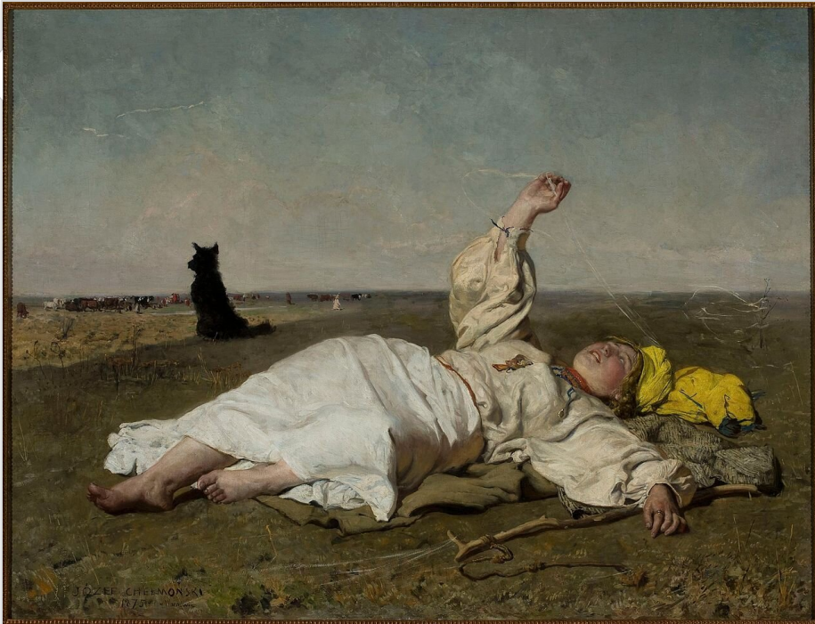
Józef Chełmoński, Babie lato , 1875