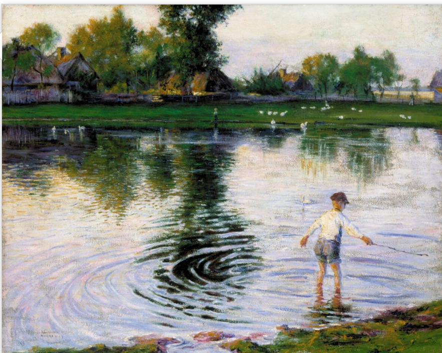
Władysław Podkowiński, Mokra Wieś , 1892 domena publiczna

z dworem. Historyczny kontekst powoduje, że dzieło Reymonta, poza mitycznym, ma także wymiar realistyczny. Ukazuje wieś przełomu XIX i XX w. Utrwala moment, gdy dawne zasady społeczne odchodzą w przeszłość i powoli rodzi się nowa wiejska rzeczywistość – chłopcy zaczynają przekraczać granice wyznaczone przez naturę i odwieczny obyczaj.