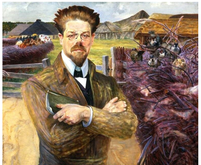
Jacek Malczewski, Portret Władysława Reymonta , 1905

Obcujac na co dzien z rodzina Borynów, mamy mozliwosc wgladnienia w swiat parobków i sluzacych (Kuba, Pietrek, Witek), ale i biedoty wiejskiej [...]. Docieramy do wiejskich urzedników (wojt, sołtys), na plebanie, w krąg ludzi „luźnych” (Rocho, ślepy dziad). [...]