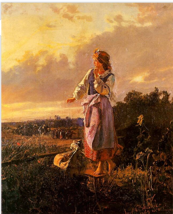
Józef Chełmoński, W ogródku , 1869

Spółeczność Lipiec, choć zróżnicowana pod względem stanu posiadania i pozycji w gromadzie, tworzy jednak wspólnotę. Manifestuje się ona przy okazji niedzielnych mszy, obrzędów religijnych, świąt czy takich wydarzeń, jak śluby i pogrzeby. Kościół jest miejscem, które jednoczy wszystkich mieszkańców wsi. Porządek świąt liturgicznych, łączący się ściśle z porządkiem natury, wyznacza rytm życia wiejskiej społeczności. W kalendarzu lipieckich chłopów współistnieją święta religijne i świeckie, wpisane w cykl przyrody. Ważne są dla nich także obrzędy odprawiane w najważniejszych momentach ludzkiego życia – w związku z narodzinami czy śmiercią. Reymont ukazuje w Chłopach specyficzny dla wiejskiej społeczności stosunek do Kościoła i religii. Religia stanowi nieodłączną część życia lipieckich chłopów, sprowadza się jednak głównie do uczestnictwa w obrzędach. Chrześcijaństwo jest dla lipczan przede wszystkim językiem symboli służących do wyrażania uczuć, przesądów czy przekonań na temat otaczającego ich świata. Tak że moralność chłopska tylko w pewnym stopniu ukształtowana jest przez wskazania religijne, stanowi raczej połączenie nakazów chrześcijańskich z zasadami obowiązującymi jeszcze w czasach pogańskich. Jedną z naczelnych wartości dla mieszkańców Lipiec jest ziemia, pojmowana w kategoriach nie tylko materialnych, lecz także mistycznych.