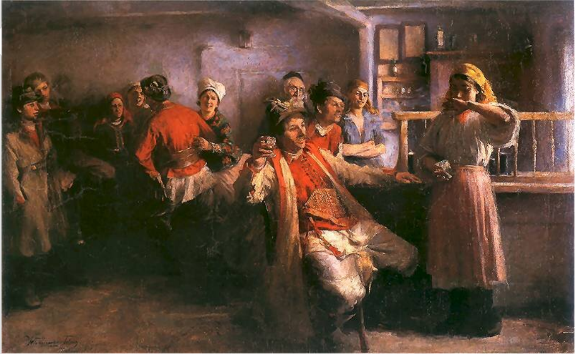
Włodzimierz Tetmajer, Zaloty , 1894