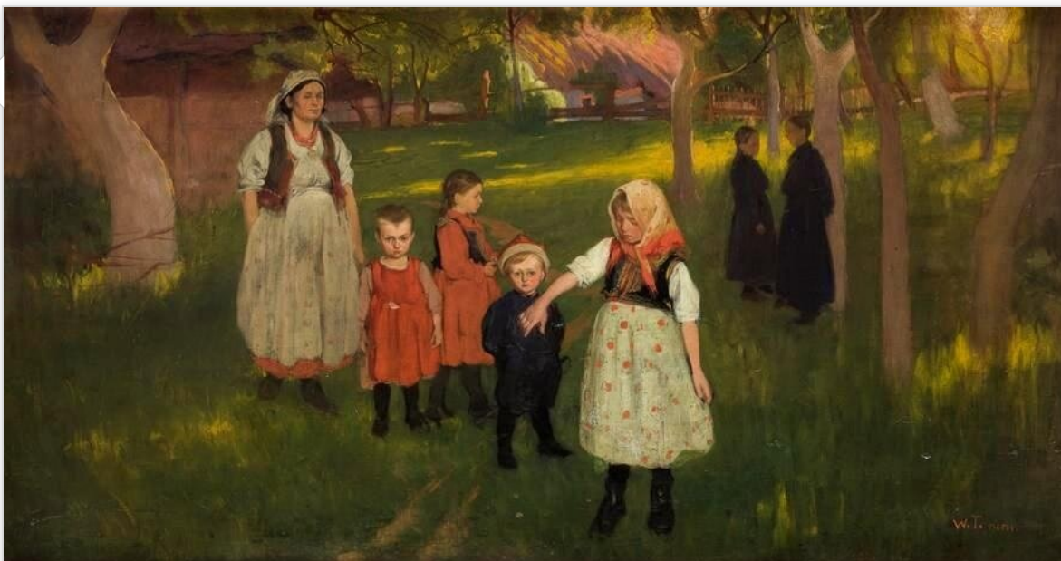
Włodzimierz Tetmajer, Dorobek (Rodzina artysty), 1905

muszą dłużej troszczyć się o los matki. „Wycug” jest dla Jagustynki życiową klęską, jednak bohaterka próbuje się nie poddawać. Walczy o swoje miejsce w gromadzie, ale jej siła tkwi już tylko w ostrych i kąśliwych słowach.