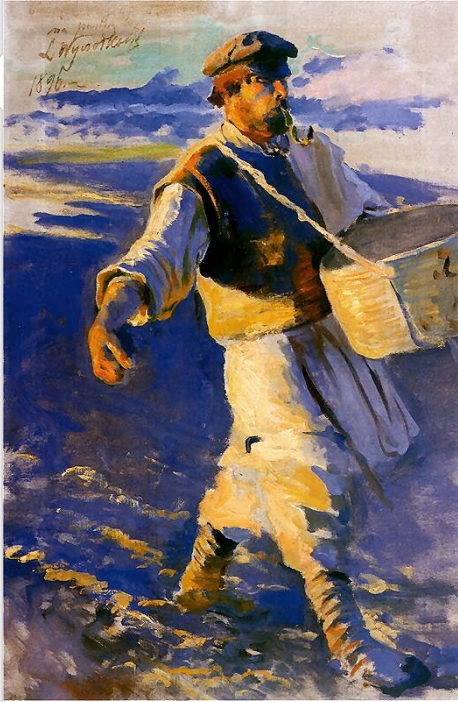
Leon Wyczółkowski, Siewca , 1896 domena publiczna