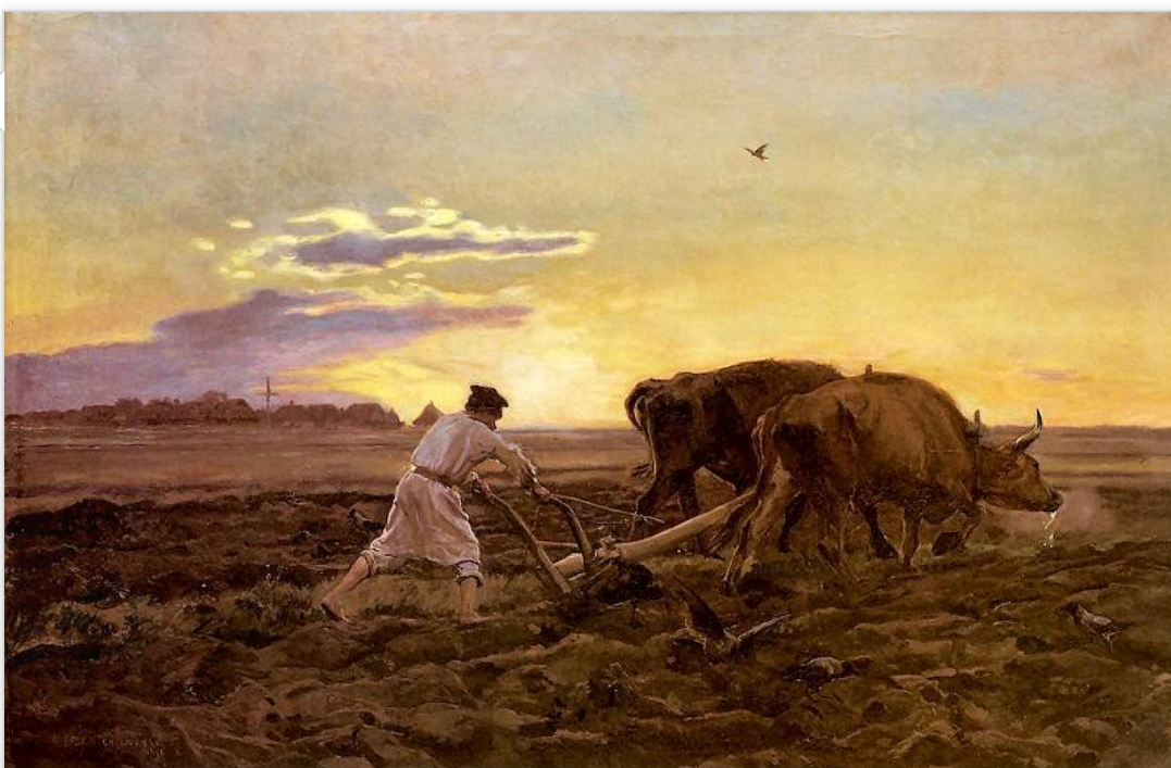
Józef Chełmoński, Orka , 1896

Na podstawie prezentacji wyjaśnij, w jaki sposób w powieści współistnieją elementy takie, jak czas i miejsce akcji oraz bohaterowie: zasady rządzące społecznością, wyznawane przez nią wartości, system, w jaki są wpisani.