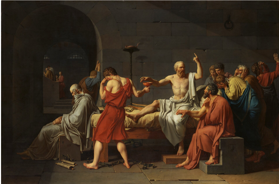
Jacques-Louis David, Śmierć Sokratesa , 1787

rzeczywistości straciła... choć nie całkowicie. Człowiek może ją odzyskać w trakcie nauki: według Platona, uczenie się to proces przypominania sobie tej pierwotnej wiedzy o świecie i prawdzie, czyli tzw. anamneza (z gr. anámnesis 'przypominanie sobie'). W tym procesie pomagają rzeczy zmysłowe, które stanowią odwzorowanie form idealnego świata. Dzięki nim umysł może dotrzeć do prawdziwych idei. Platon mówi o tym w Fedonie :