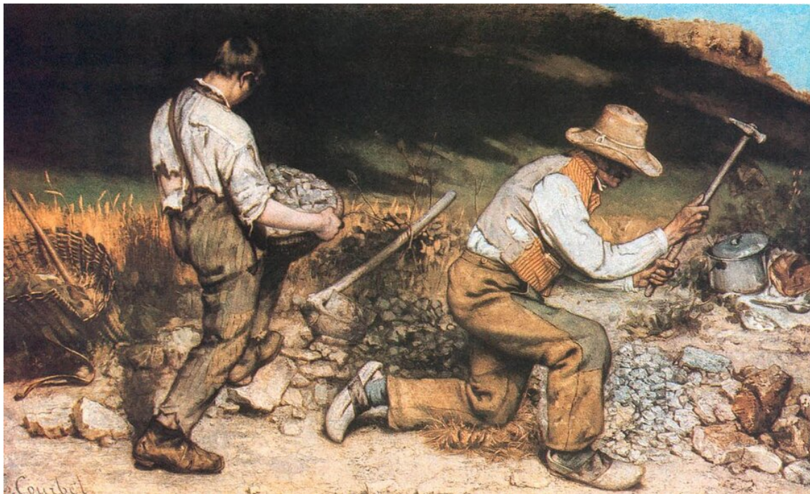
Gustave Courbet, Kamieniarze , 1849

Przyjrzyj się dziełu Gustave'a Courbeta i napisz w kilku zdaniach, jakie cechy realizmu zawiera obraz Kamieniarze . Co, według ciebie, może mieć wspólnego realizm w sztuce z realizmem literackim? Swoją odpowiedź uzasadnij.