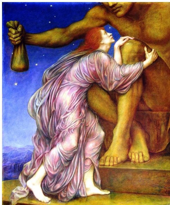
Evelyn De Morgan, Ubóstwianie Mamony , 1909

Źródło: Honoriusz Balzak, Ojciec Goriot , tłum. Tadeusz Boy-Żeleński, Warszawa 1966, s. 11-13.