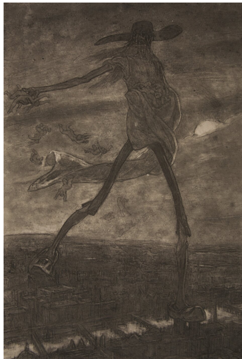
Félicien Rops, Szatan siejący plewy , 1882

Źródło: Zygmunt Krasiński, Nie-Boska komedia , oprac. M. Grabowska, Wrocław 1974, s. 20–25.