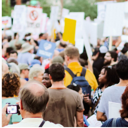
Badanie opinii publicznej