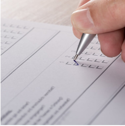
Badania opinii publicznej: historia, metody i ośrodki