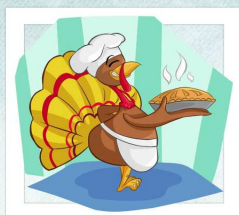
Indyk piecze ciasto.