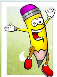
Ołówek skacze z radości.