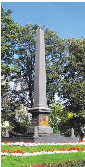
Zdjęcie 1. Pomnik Unii Lubelskiej