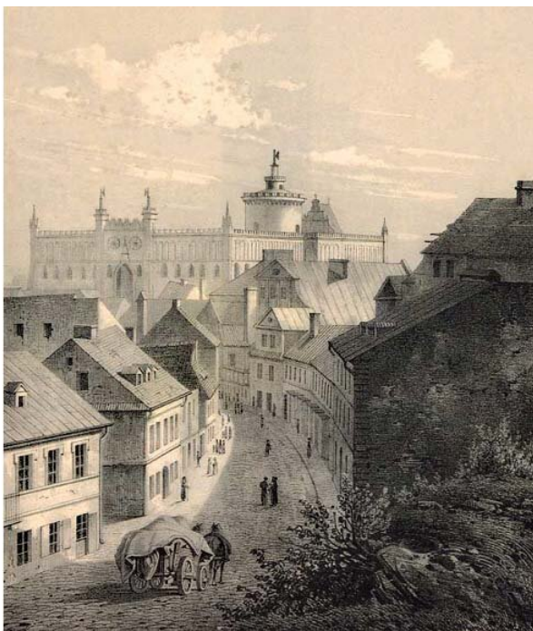
Zdjęcie 2. Rok 1860. Litografia Adama Leure