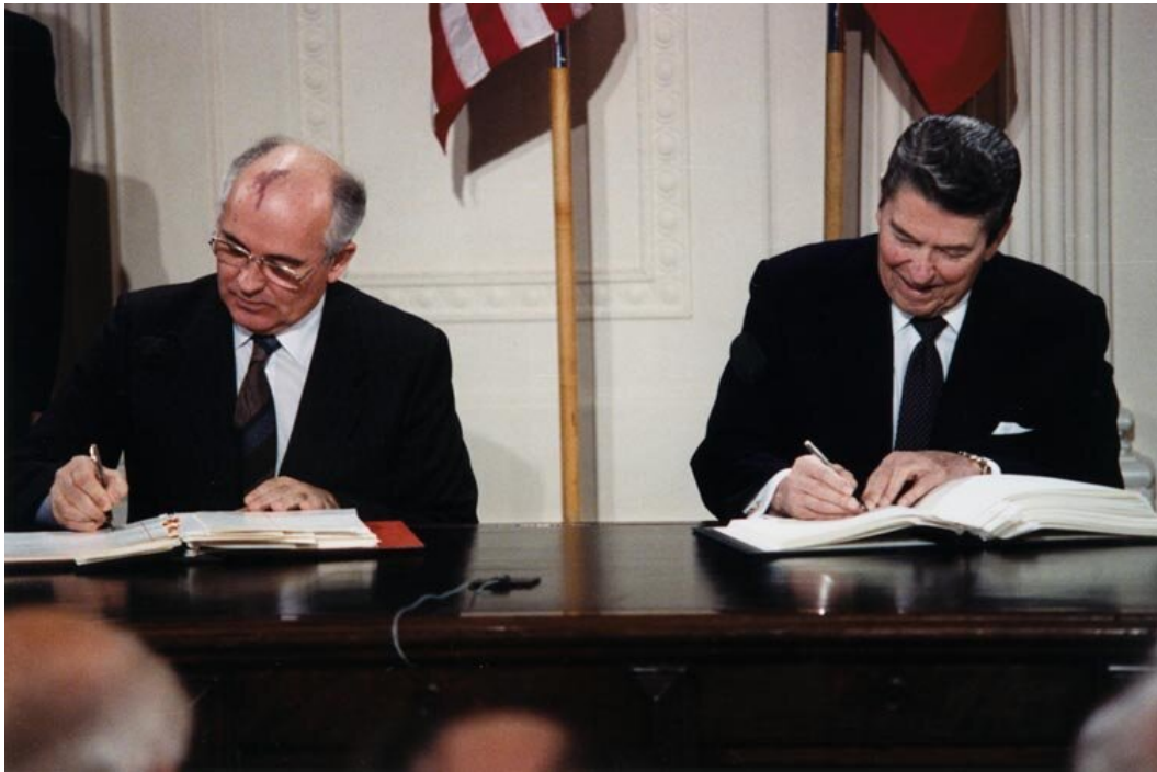
Michaił Gorbaczow i Ronald Reagan