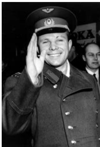
Jurij Gagarin podczas wizyty w Szwecji, 1964 rok