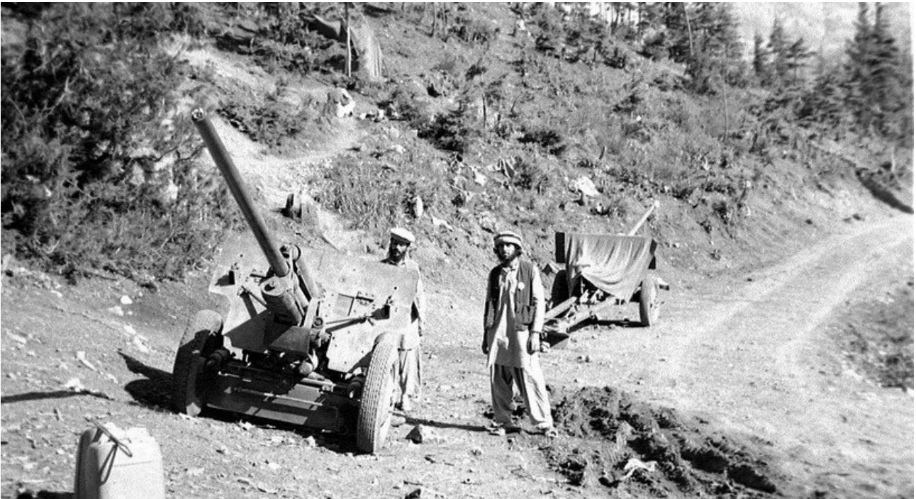
Afgańczycy ze zdobytymi działami sowieckimi