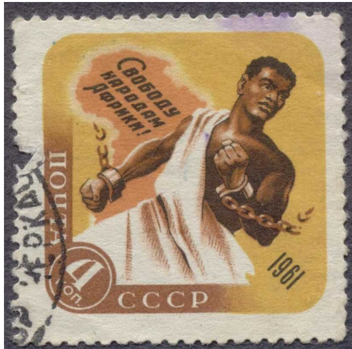
Znaczek „Wolność narodom Afryki”

Chruszczow popierał państwa-kolonie, które odzyskiwały niezależność, ogłaszając się sojusznikiem narodów walczących z kolonializmem.