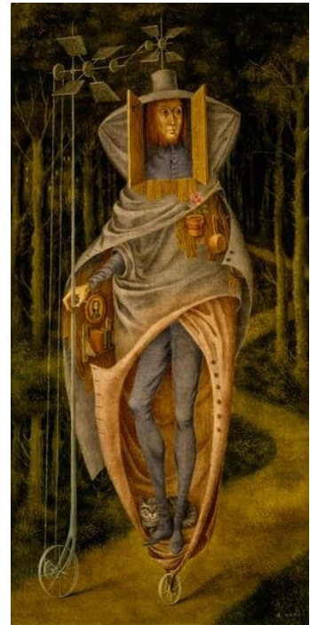
Remedios Varo, Włóczęga , XX w.

Źródło: Mirosław Pęczak, Kto dziś pamięta Edwarda Stachurę? , „Polityka” 24.07.2019.