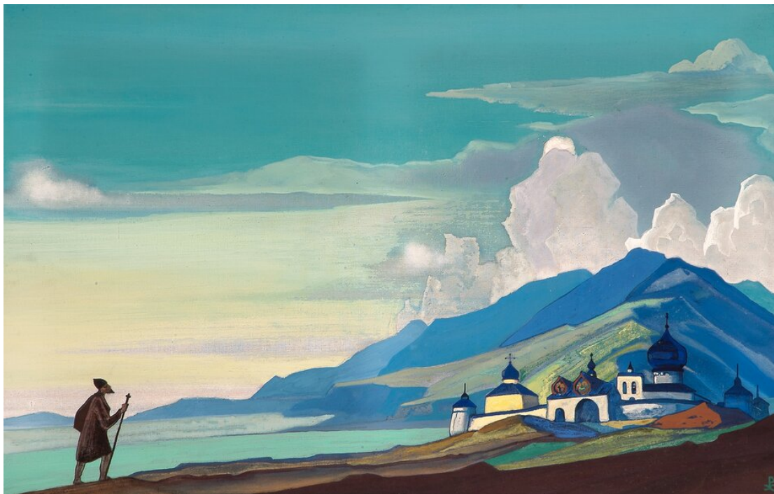
Nicholas Roerich, Wędrowiec ze Wspaniałego Miasta , 1933