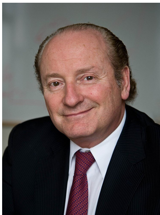
Robert K. Merton (1910–2003) – amerykański socjolog, członek zagraniczny Polskiej Akademii Nauk.

Jednostki starają się dostosować do sytuacji anomii. O ile jednak przystosowanie społeczne w sytuacji równowagi między celami i środkami ich osiągnięcia polega na konformizmie,