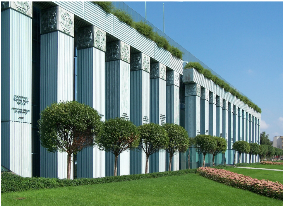
Gmach Sądu Najwyższego w Warszawie

Pozycję ustrojową Sądu Najwyższego wyznacza art. 183 ust. 1 Konstytucji RP stanowiący, że Sąd Najwyższy sprawuje nadzór nad działalnością sądów powszechnych i wojskowych w zakresie orzekania, co wyraża zasadę nadzoru judykacyjnego Sądu Najwyższego. SN jest sądem kasacyjnym w sprawach rozstrzyganych przez sądy powszechne i wojskowe. Kasacja oznacza możliwość jedynie uchylenia zaskarżonego orzeczenia, bez możliwości merytorycznego rozpatrzenia sprawy i wydania orzeczenia.