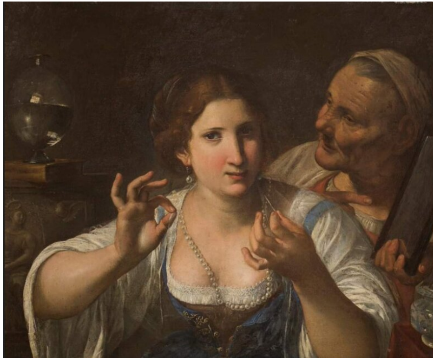
Angelo Caroselli, Alegoria Vanitas , pomiędzy 1625 a 1630