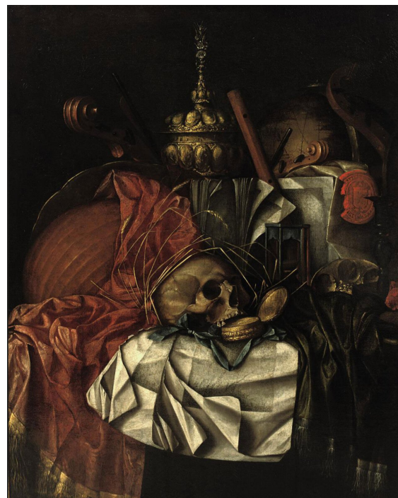
Franciscus Gijsbrechts, Vanitas, ok. 1675