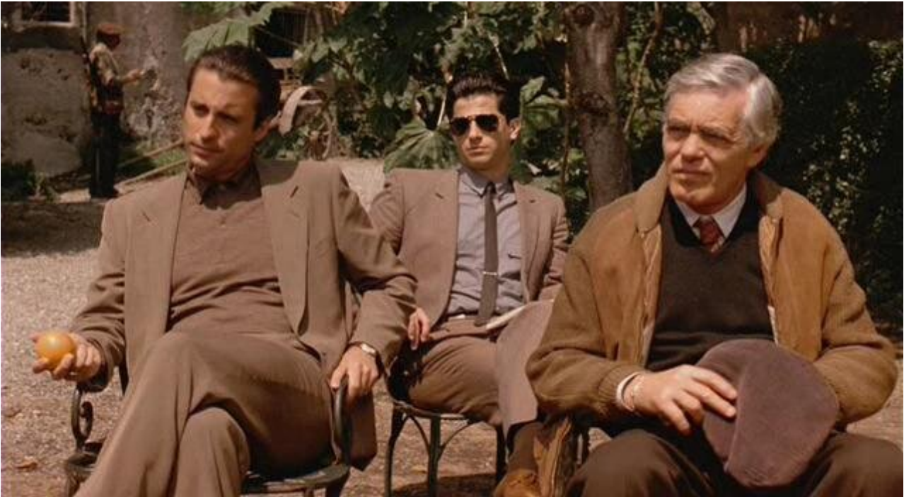
Kadr z filmu Ojciec chrzestny III