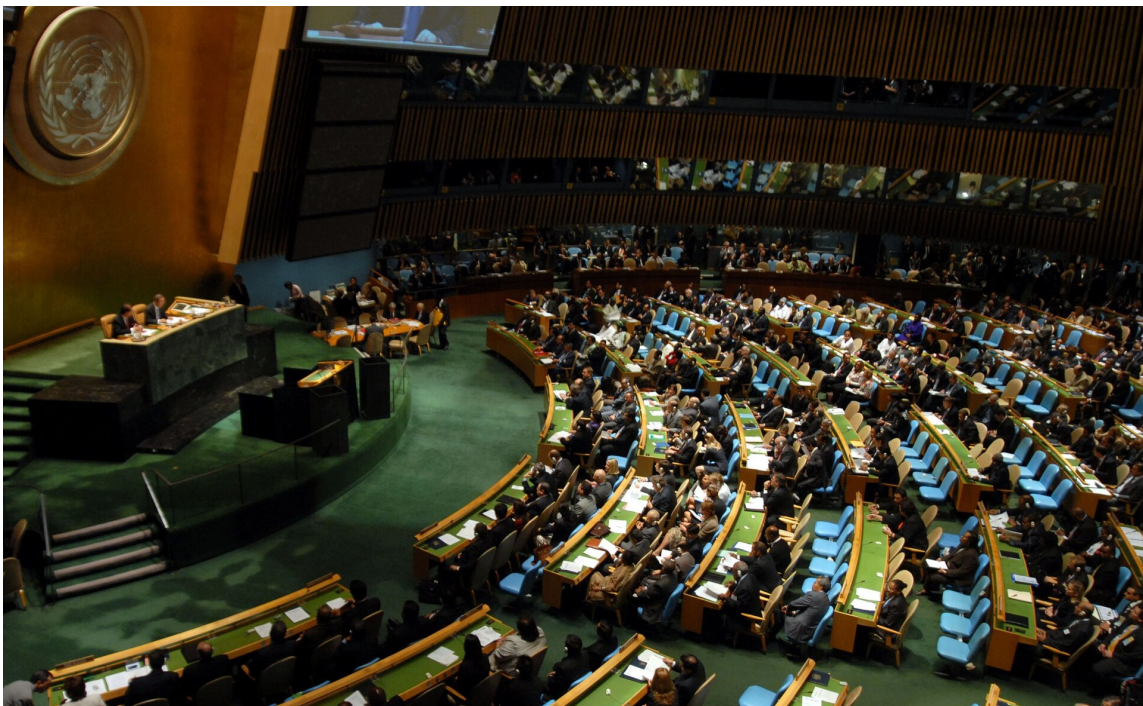
Posiedzenie Zgromadzenia Ogólnego ONZ.

Ze względu na swój wyjątkowy, uniwersalny charakter oraz uprawnienia wynikające z umowy założycielskiej – Karty Narodów Zjednoczonych – organizacja może podejmować działania w szerokim zakresie zagadnień. Stanowi dla 193 państw członkowskich forum do wyrażania swoich poglądów za pośrednictwem Zgromadzenia Ogólnego , Rady Bezpieczeństwa , Rady Gospodarczej i Społecznej oraz innych organów i komitetów.