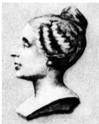
Marie-Sophie Germain (1776 – 1831)