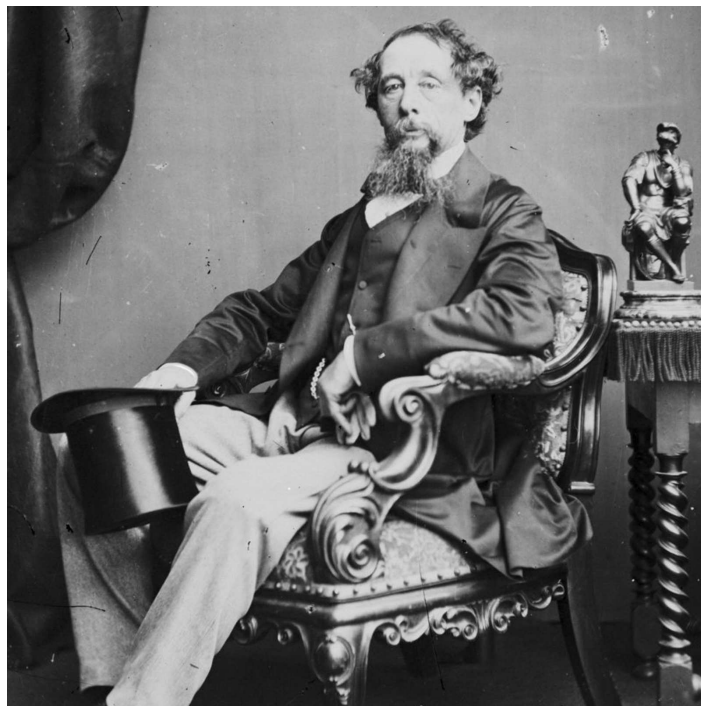
Charles Dickens (1812-1870)

The man sitting in the chair is the author of “Christmas Carol,” Charles Dickens. Apart from being a writer, he was also a social critic. He is considered to be one of the most recognisable novelists of the Victorian era. His short stories and novels were well-known and read all over the world. Have you read any of Dickens’ books? Which one? Actually, the books are still widely read today. A vast number of quotes from them are commonly used in everyday language. In this part of the material, you will revise the main characters and symbols and get familiar with a few quotes from this novella.