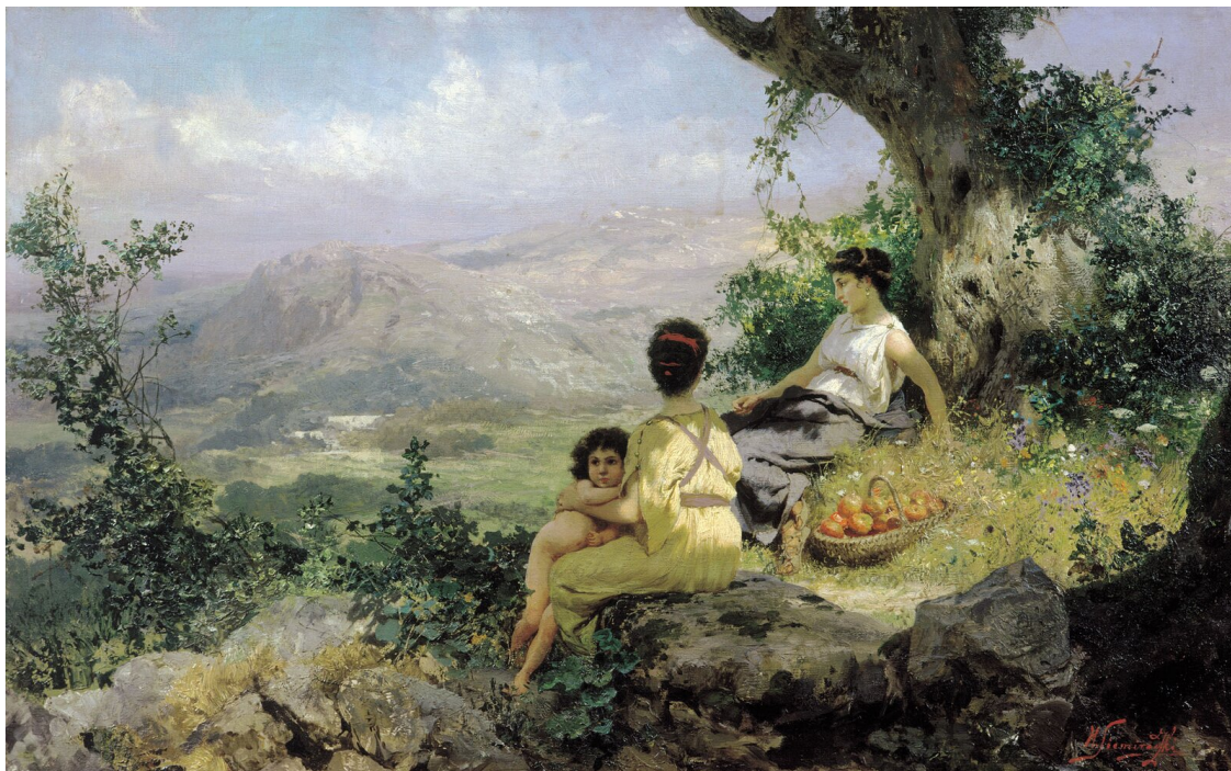
Henryk Siemiradzki Idylla

Źródło: Henryk Siemiradzki, Sielanka , 1890, olej na płótnie, Narodowa Galeria Sztuki we Lwowie, domena publiczna.