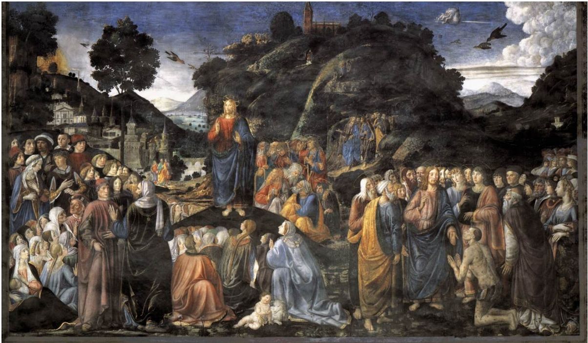
Cosimo Rosselli [czyt. Kozimo Roselli] Kazanie na Górze