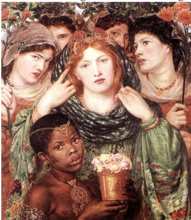
Dante Gabriel Rossetti Oblubienica

Zapoznaj się z obrazem Oblubienica Dantego Gabriela Rossettiego i wykonaj polecenie.