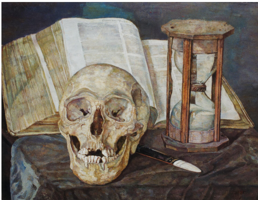
Corrie Pabst, Vanitas , 1908