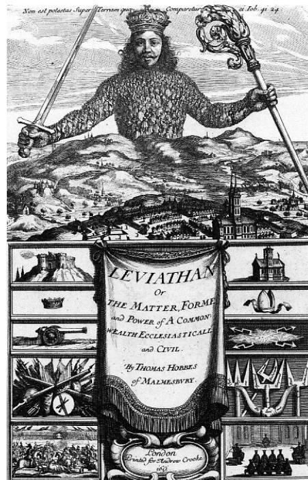
Okładka Lewiatana , wydanie z 1651 r.

Tylko ta druga droga jest zdaniem prekursorów liberalizmu właściwa. Nazywamy ich prekursorami liberalizmu, a nie liberałami w pełnym tego słowa znaczeniu, bo nie ujmują jeszcze wolności w jej aspekcie politycznym, tj. nie mówią o czynnym i biernym prawie wyborczym. Celem i sensem istnienia władzy jest, ich zdaniem, zapewnienie obywatelom wolności – nieważne jednak, kto wykonuje tak rozumianą władzę, nie musi mieć ona charakteru demokratycznego. Liberałowie są natomiast zdecydowanymi zwolennikami demokracji , a więc ustroju, w którym wszyscy obywatele mają jednakowe uprawnienia polityczne i jednakowy dostęp do władzy (mogą wybierać jej przedstawicieli lub sami być wybierani i ją sprawować).