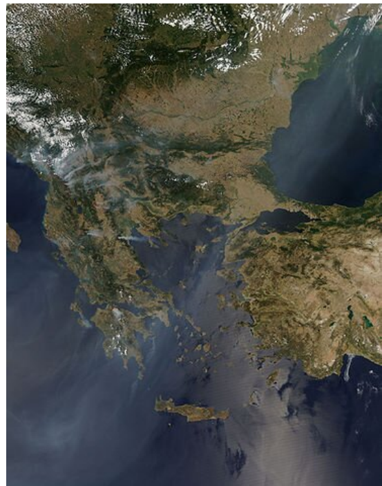
Półwysep Bałkański, zdjęcie satelitarne, widok na Grecję

z rozważaniami spekulatywnymi, czyli tworzeniem teorii dotyczącej określonego tematu, na przykład natury piękna, wynikającej z namysłu nad danym zagadnieniem. Logos , tzn. rozum, którym zostały obdarzone między innymi istoty ludzkie, umożliwia poznanie, a więc odkrywanie najbardziej ogólnych prawd dotyczących świata i człowieka. Mądrość wytwarzana poprzez teoretyczne rozważania filozofek i filozofów nie ma praktycznego zastosowania, a przynajmniej nie to powinno być jej nadrzędnym celem. Spekulatywne poznanie stanowi wartość samą w sobie, a wyłaniająca się z niego prawda istnieje ze względu na nią samą. Powyższe pojmowanie filozofii jako umiłowania mądrości, stanowi najpopularniejszą definicję tej dziedziny wiedzy, uznawaną za klasyczną, lecz nie jedyną. W toku historii ludzkości rozumienie tego, czym jest filozofia, podlegało zmianom.