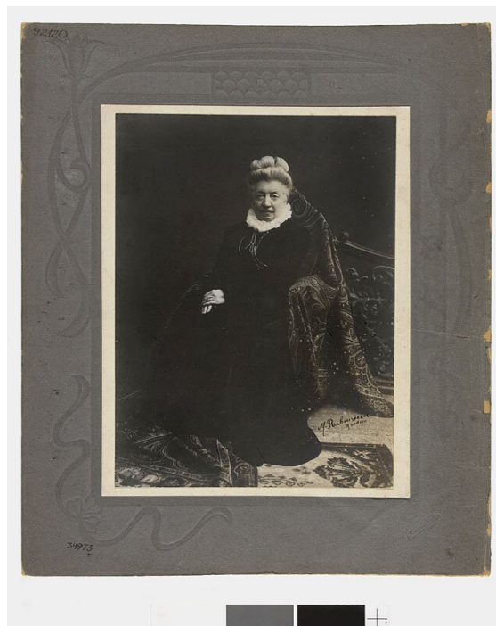
Portret Elizy Orzeszkowej, 1900-1910

Źródło: Cyfrowe zbiory Muzeum Narodowego w Warszawie, domena publiczna.