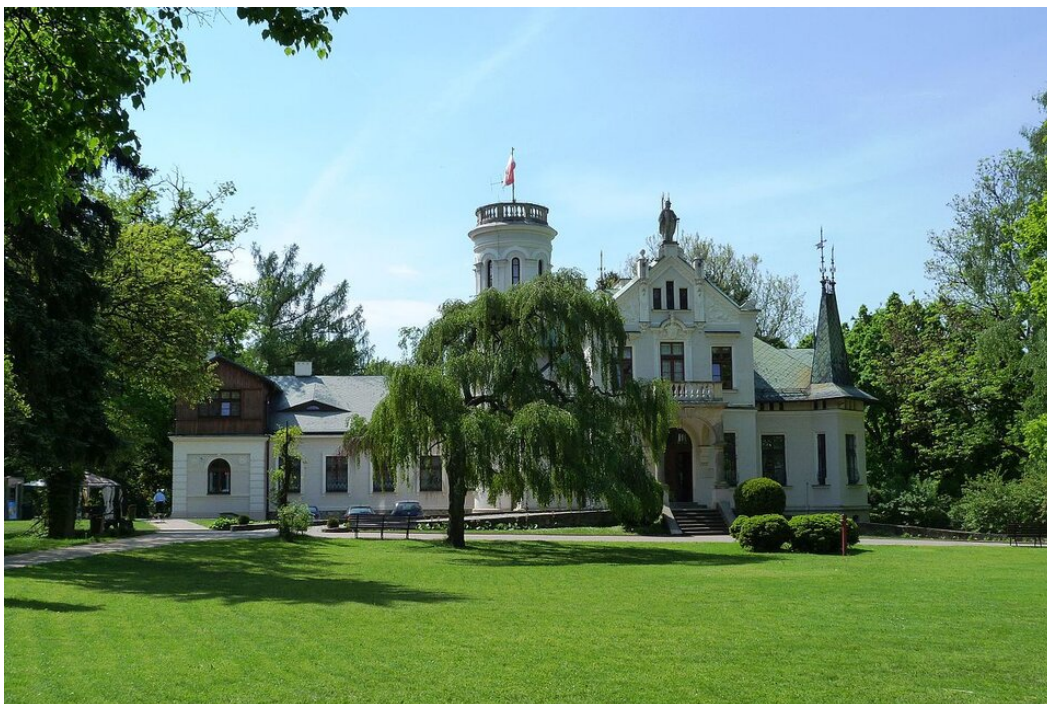
Pałacyk w Oblęgorku, widok współczesny

się najbrzydszych swych i nieużytecznych przedmiotów”. [...] Pisarz podziękował za Oblęgorek: „Tę pracę moją kraj wynagradza... Z serca wrywa mi się tylko okrzyk: Dzięki krajowi, dzięki wam panowie z Komitetu”.