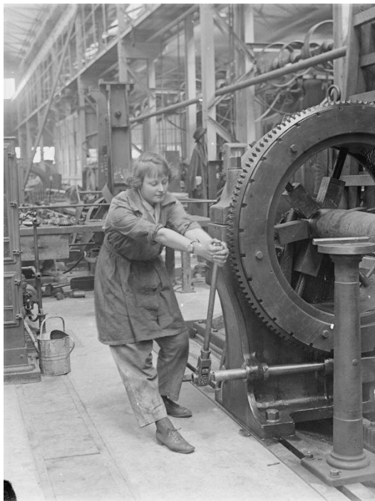
Pracownica Królewskiej Fabryki