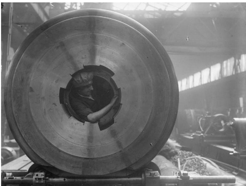
Pracownica czyszcząca lufę