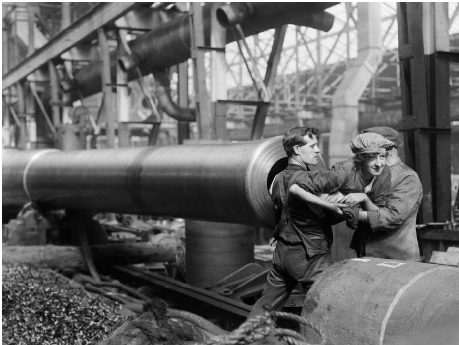
Pracownica wychodząca z lufy