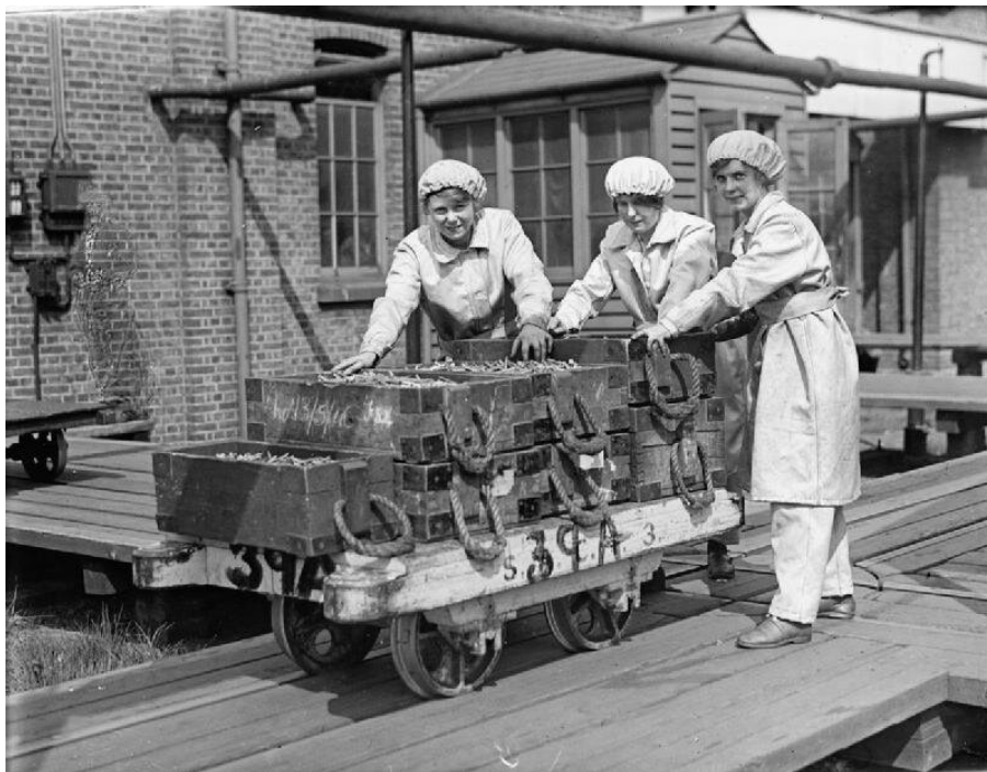
Kobiety pchające wagon z łuskami do amunicji