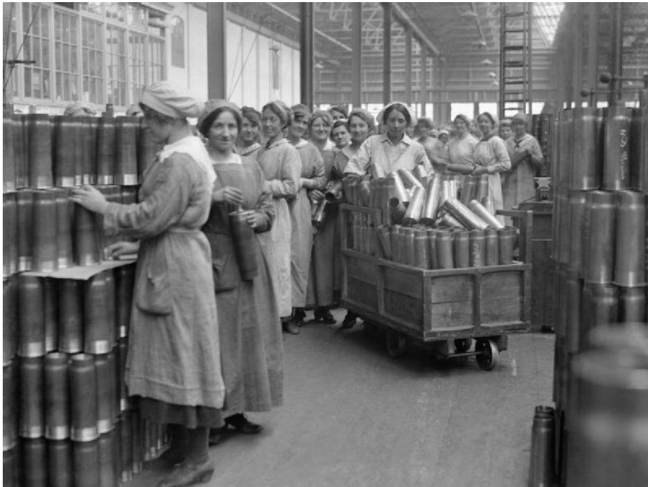
Kobiety pracujące przy wytwarzaniu amunicji