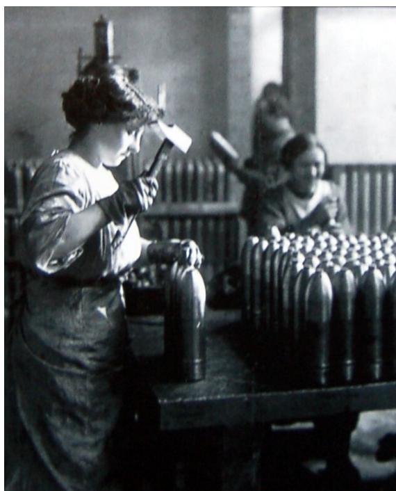
Kobieta pracująca w fabryce