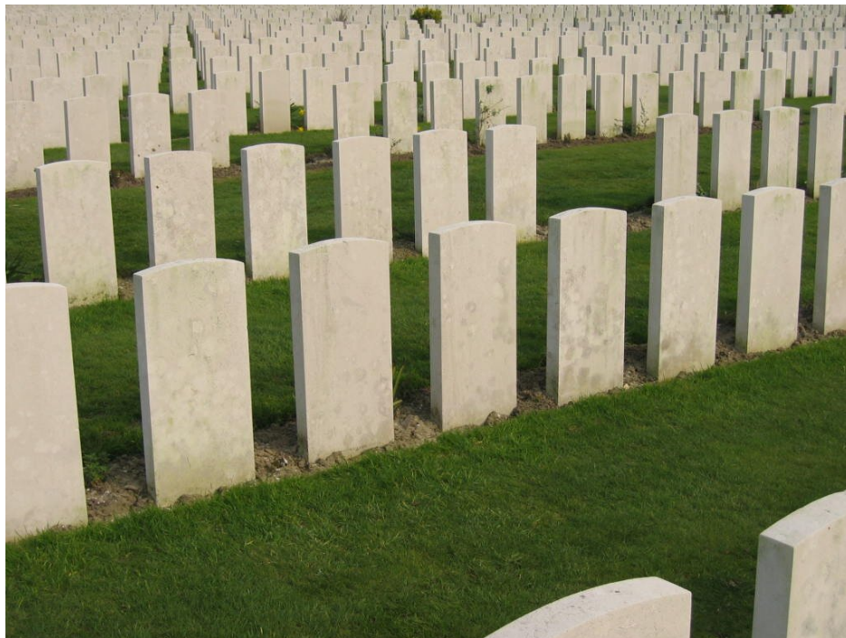
Cmentarz Tyne Cot